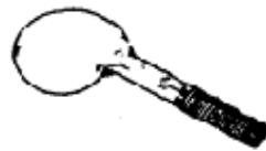
Llave de cincho